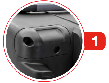
4x Corner Cap 4x capuchons de coin