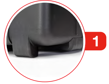
Molded Corners Coins moulés