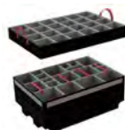
Padded Divider Séparateurs coussinés