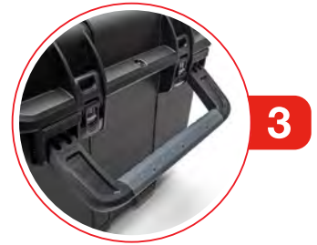
Oversize Team-Carry Handles/Pull Handle Poignées de transport d'équipe surdimensionnées