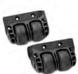
Set of 2 double wheels Ensemble de deux roues doubles