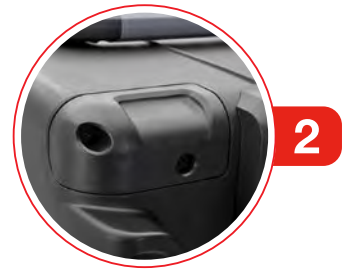
2x Corner Cap 2x capuchons de coin