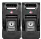
TSA Approved Latches Fermoirs à serrures TSA