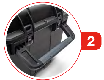
Oversize Team-Carry Handles Poignées de transport d'équipe surdimensionnées