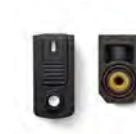
Panel Installation Kit Kit d'installation pour panneau