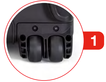
Four (4) Polyurethane Wheels (4) roues en polyuréthane