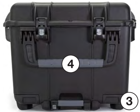
OverSize Team-Carry Handles Poignées de transport d'équipe surdimensionnées