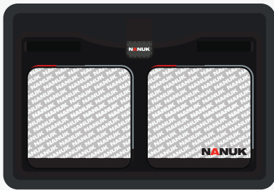
Lid Organizer | Organisateur de couvercle