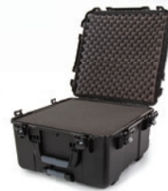
*Shown with foam option. * Montré avec option mousse.

At 21.5 inches long and nearly 11.8 inches deep, the NANUK 968 can store a whole lot of your essentials. The NANUK 968 hard case offers the maximum level of protection for all of your professional equipment. The protective case adds the convenience of wheels to make traveling much easier with your audio gear, video gear, photo gear, industrial equipment, outdoor gear and much more! Three soft-grip handles make this wheeled case one of the most convenient on the market. The NANUK 968's polyurethane wheels withstand rough terrains while the one-handed retractable handle offers unparalleled usability. No matter where you go you're guaranteed a smooth ride. For total equipment protection, look no further than the NANUK 968's indestructible waterproof resin shell and patented superior PowerClaw latches. Trust the world's best protective case to get your gear safely from point A to point B.