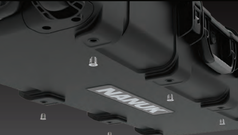
8x M8 Threaded Steel Inserts 8x inserts filetés en acier M8