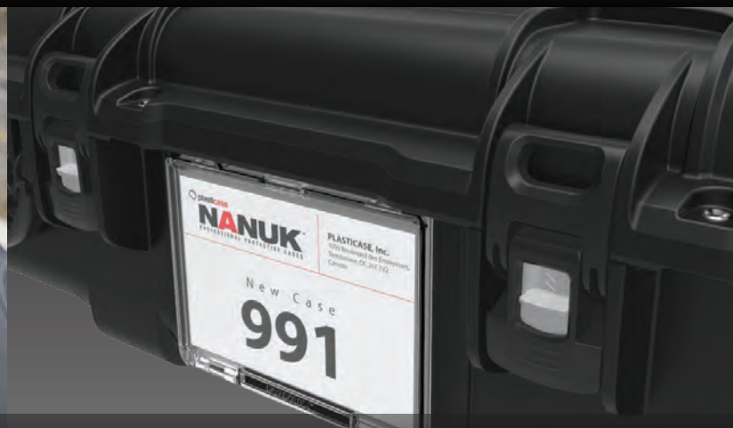
ID Window Compatible (Optional) Compatible avec fenêtre d'identification (en option)