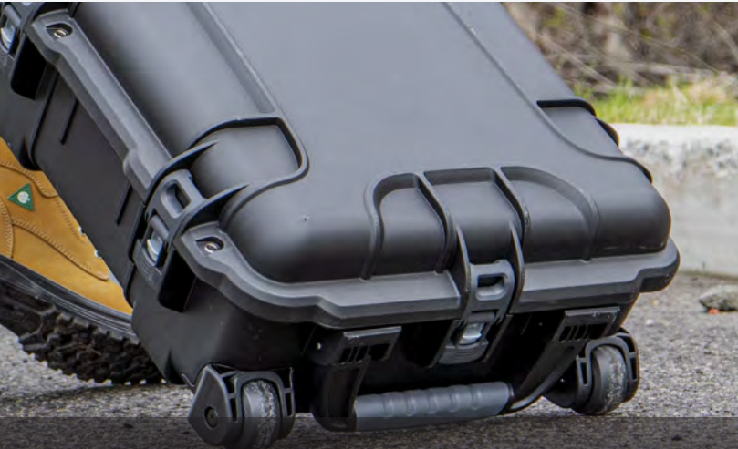
2 Large and Strong Polyurethane Wheels 2 grandes et solides roues en polyuréthane