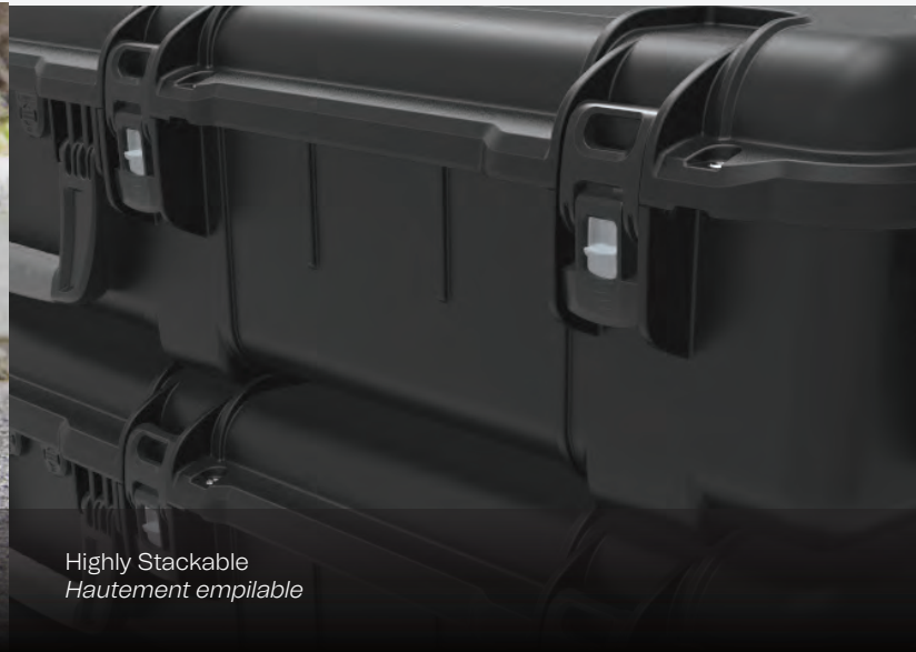
Highly Stackable Hautement empilable