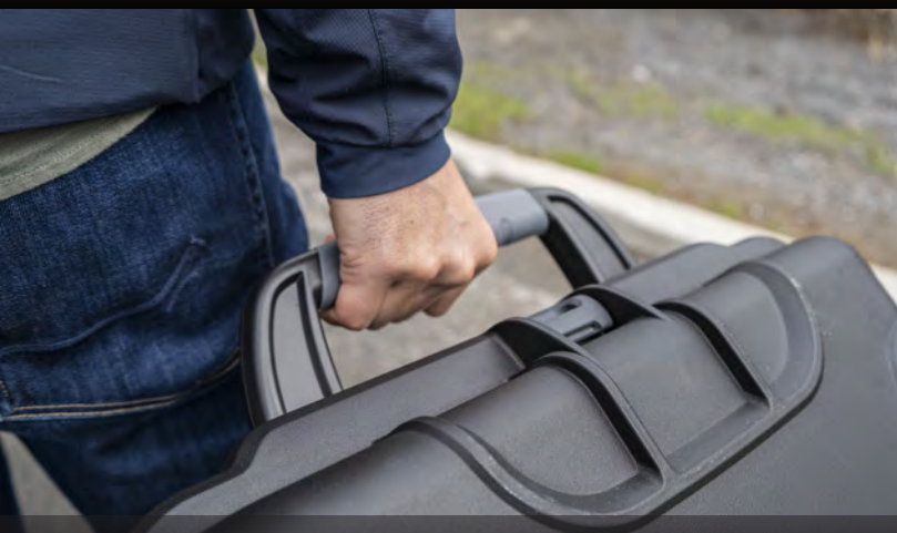
3 Soft Grip Strong Handles 3 poignées solides à prise souple