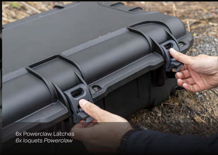
6x Powerclaw Latches 6x loquets Powerclaw