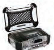
Custom Panel Panneau personnalisé