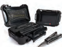
Custom Foam Mousse personnalisée