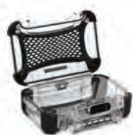
Lexan Panel Ensemble de panneaux en Lexan