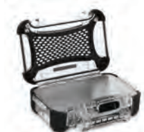
Aluminum Panel Ensemble de panneaux en aluminium