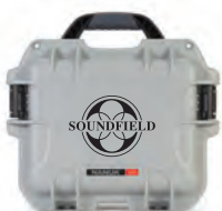
Custom Printing Impression personnalisée