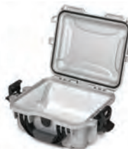
Lexan Panel Ensemble de panneaux en Lexan