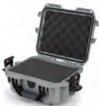
Multilayer Cubed Foam Mousse en cube multicouches