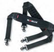
Shoulder Strap Sangle d'épaule