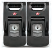
TSA Latch Retrofit Kit Ensemble de fermoirs TSA