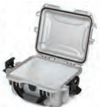
Aluminum Panel Ensemble de panneaux en aluminium