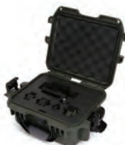
Custom Foam Mousse personnalisée