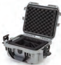
Padded Divider Séparateurs coussinés