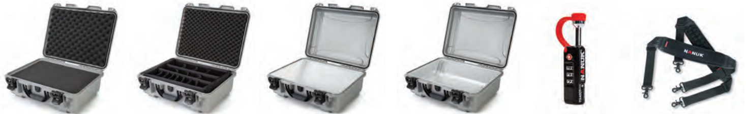
Multilayer Cubed Foam Mousse en cube multicouches