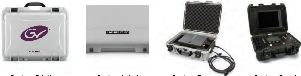
Custom Printing Impression personnalisée